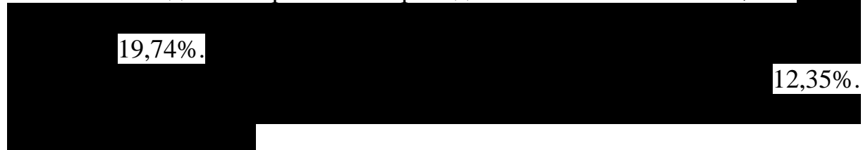
Структура электропотребления во 2 квартале 2012 г.

Во 2 квартале 2012 г. в структуре полезного отпуска электроэнергии значительная доля потребления приходится на население - 27,08%